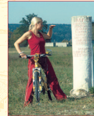
Kopie eines Meilensteins beim Kastell in Pfünz

Alles Wissenswerte zum Welterbe Limes in Bayern vermittelt das Bayerische Limes-Informationszentrum, das dem Römermuseum der Stadt Weißenburg i. Bay. angegliedert ist.