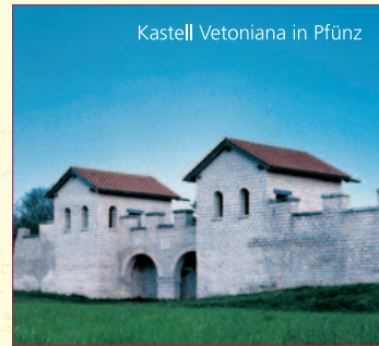
Kastell Vettoniana in Pfünz

Römer und Bajuwaren Museum/Infopoint Limes Juliane Schwartz · Burg Kipfenberg 85110 Kipfenberg · Tel. 08465/905707 · Fax 08465/905708 bajuwarenmuseum@altmuehlnet.de www.bajuwaren-kipfenberg.de